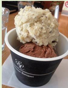
(上) チョコレートアイス！美味！