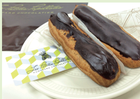
(右) エクレアもありました！